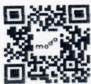
地方政府身心障礙者 職業重建服務窗口